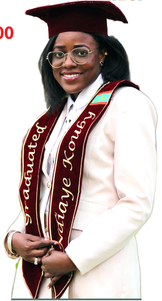
■ ملاك تجاني

كوبي تزور العديد من الولايات وذلك لرغبتها في التواصل والتقرب إلى زميلاتها الموريتانيات المتواجدات في العديد من الجامعات بسكره ووهران والجزائر والبليدة