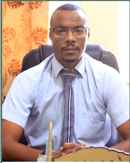
البروفيسور درويش سمير