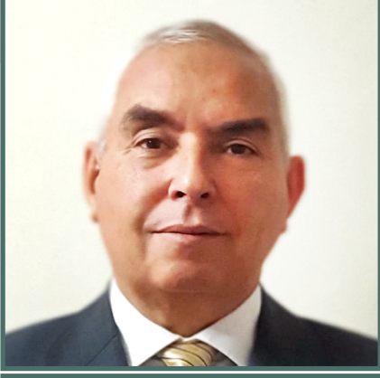
■ بقلم: د. خليفة قييد

والإيطالي الغاشم كما ناضلت وتعاونت فيما بينها وكافحته جنبا إلى جنب بالسلح والسياسة حتى نالت حريتها. ويعد الاستقلال، تعززت هذه العلاقات بإبرام اتفاقيات مشتركة على مستوى القمة وعززتها اتفاقيات أخرى على مستوى القاعدة لا سيما بين الولايات الحدودية، خاصة الجزائرية-التونسية، متمنيا للتعاون وتعزيزا لروح الأخوة وحسن الجوار. لا مبالغة إذا، عندما نقول بأن هذه العلاقات القوية خاصة على المستوى القاعدي الشعبي تتجلى، عندنا، في استمرار تقوية العلاقات التجارية وروابط القربى وحسن الجوار مثل إحياء بعض الاحتفالات الشعبية في وادي سوف على غرار حضرة الفرجان على الحدود الشرقية من تراب الولاية حيث يهب إليها، في كل سنة من موسم الربيع، فصائل من قبيلة فرجان ليبيا وتونس والجزائر. وقس على ذلك عروش وقبائل أخرى لها احتفالات طقوسية مشتركة على مستوى حدود هذه البلدان.